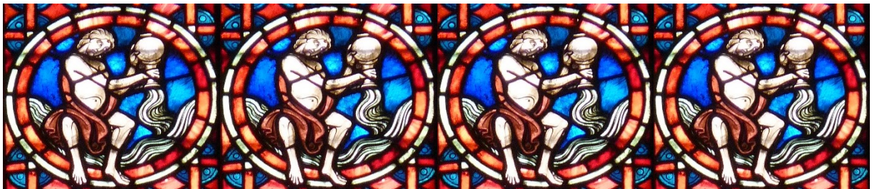
Images : 1. Ivan Aivazovsky (1817-900), Chaos, The Genesis . 2. Auteur inconnu, Écuries d'Augias. 3. Détail vitrail église de Tréhorentec. 4. Frise : Soissons, Cathédrale.

Ainsi pourra s'incarner, en nous et dans notre monde, « le mythe d'Aquarius 4 [qui] symbolise l'homme parfait et sublimé, sauvé ou renaissant de l'« abîme », et qui féconde le monde des eaux de la Vie nouvelle (5) ».