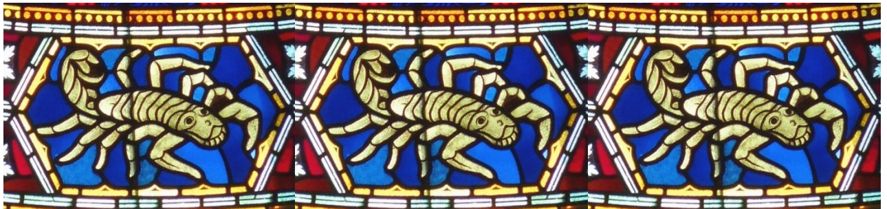
Images : 1. Vienne, Cathédrale Saint Maurice. 2. Oslo, Vigeland Park. 3. Frise : Arlon, Eglise Saint Martin.

Je suis le Scorpion. À tout moment, je suis là pour t'accompagner, pour vous accompagner tous, dans ce processus de métamorphose. Il suffit de me le demander. »